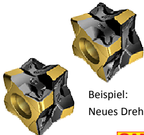
Beispiel: Neues Drehkonzept